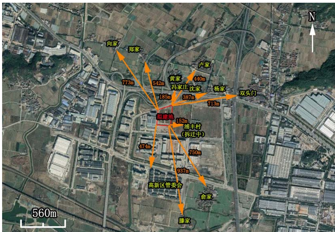
图 3-1 主要敏感目标示意图